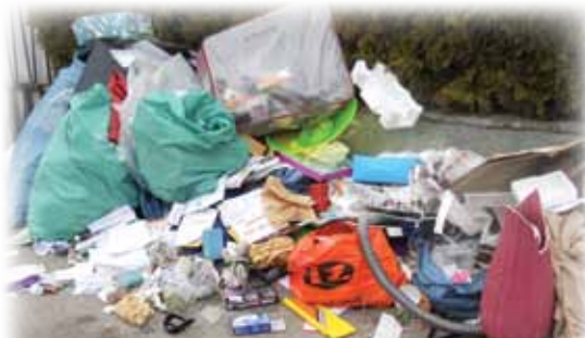
Fast nur Restmüll, der in die Tonne passt!

FALSCH! Kfz-Zubehörteile wie Autoreifen und Felgen, Autobatterien und Kotflügel, Motorräder, Rasenmäher mit Benzinmotor, Abfälle von Bau- und Umbauarbeiten wie Bauschutt, Kanalrohre aus Beton oder Keramik, Ziegel usw., Eisen aller Art und Heizungskessel, Öltanks und Ölbehälter, Verpackungsmaterialien, Gartenabfälle, Schadstoffe, Altkleider, Federbetten, Decken, Geschirr, Säcke und Schachteln, Kartons oder andere Behältnisse, verpackte Kleinteile oder Restmüll.