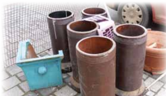
Steingut, Ziegelgefäße und Baustoffe sind Bauschutt