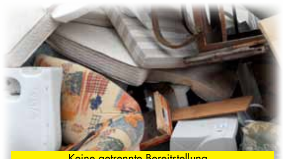
Keine getrennte Bereitstellung – Bildschirme unter Matratzen u. Möbel