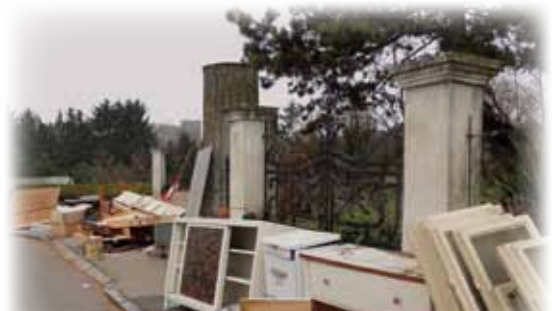
Diese Menge an Sperrmüll wird nicht mitgenommen!